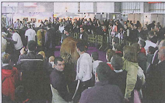
La Ferme en Ville de Valenciennes en 2006 a accueilli plus de 25000 visiteurs sur les 3 jours!

« Agriculture de proximité, agriculteurs de qualité! » est le thème choisi par les agriculteurs pour la Ferme en Ville 2010. L'objectif est de rassurer le consommateur sur nos méthodes de travail, de leur montrer l'intérêt de consommer local, régional et français, et